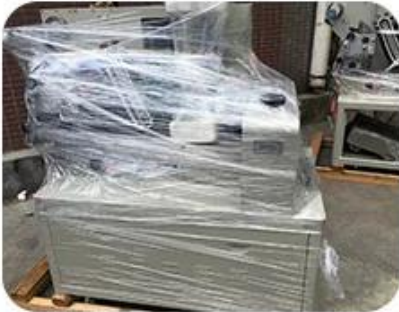
Clean and film up after adjustment