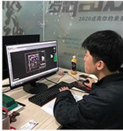
2. Design drawings