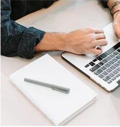
1. Set a strategy