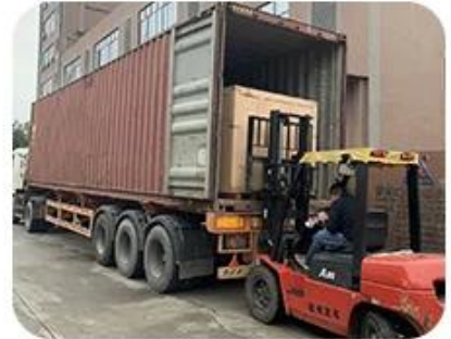
Loading and deliver