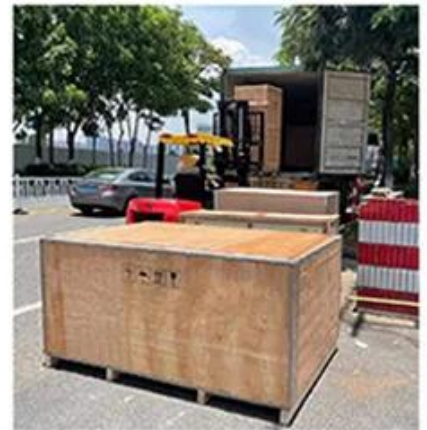
6. Packaged and shipped

Professional engineers provide technical support to customers.