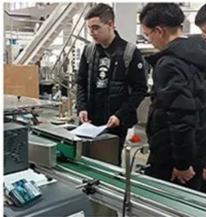
5. Factory acceptance