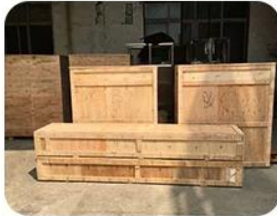
Pack in wooden case