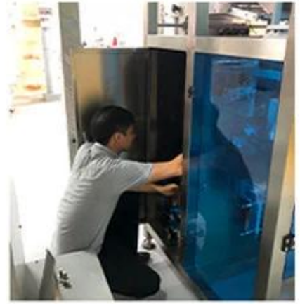
3. Machine production