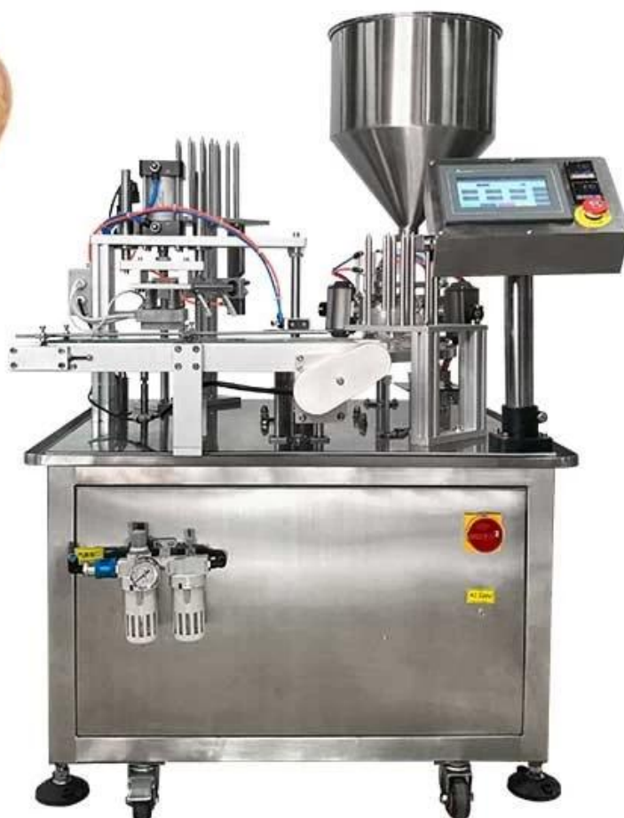
Detalle del produca