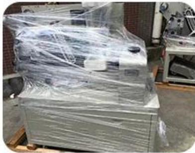
Clean and film up after adjustment