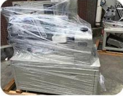
Clean and film up after adjustment