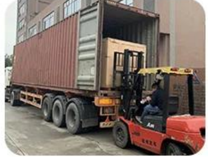
Loading and deliver