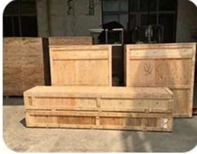
Pack in wooden case